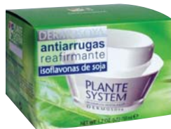
CREMA ANTIARRUGAS REAFIRMANTE