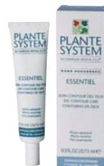
CONTORNO DE OJOS